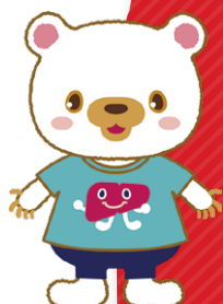
啓発用マスコット ポリイちゃん