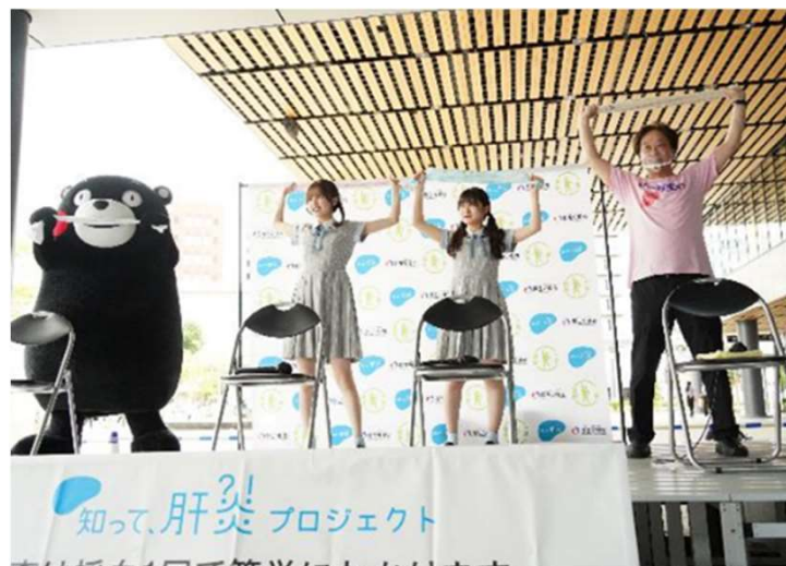
↑ 肝炎体操の様子 ↑