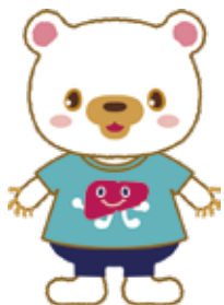
啓発用マスコット ポリイちゃん